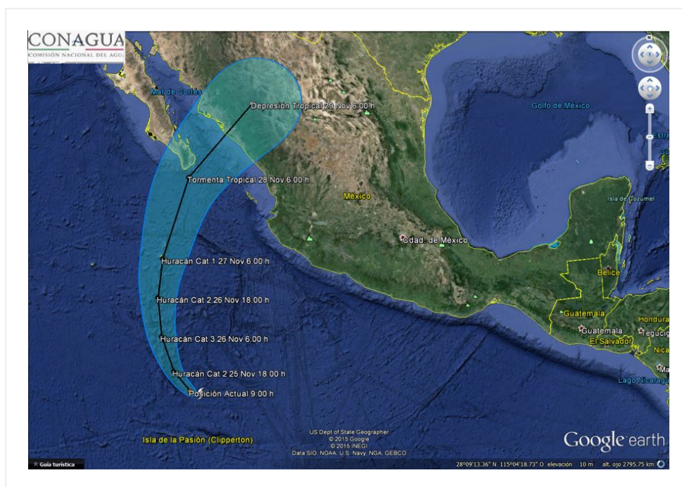
Imagen de Trayectoria